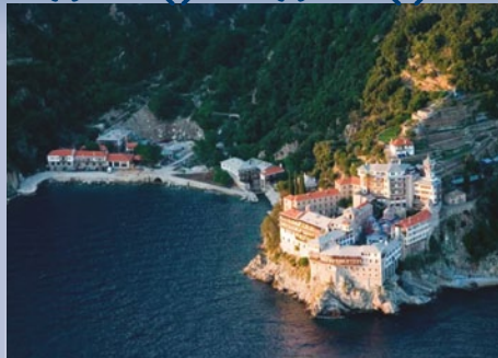
9-13 Νοεμβρίου Άγιον Όρος