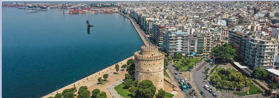
26-30/12 ΕΚΔΡΟΜΗ ΝΕΟΤΗΤΟΣ ΣΤΗ ΘΕΣΣΑΛΟΝΙΚΗ Πληροφορίες στα τηλέφωνα: 2104614658, 6938671369