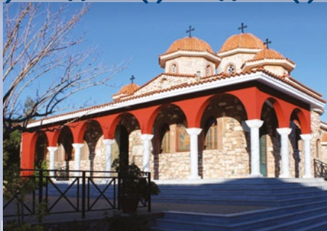
6 Νοεμβρίου Ιερά Μονή Γαλακτοτροφούσας Μεγάρων