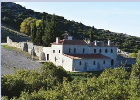
14 Δεκεμβρίου Ιερά Μονή Προφίτου Ηλιού Βερθέρων