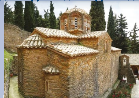
30 Νοεμβρίου Ιερά Μονή Αστερίου